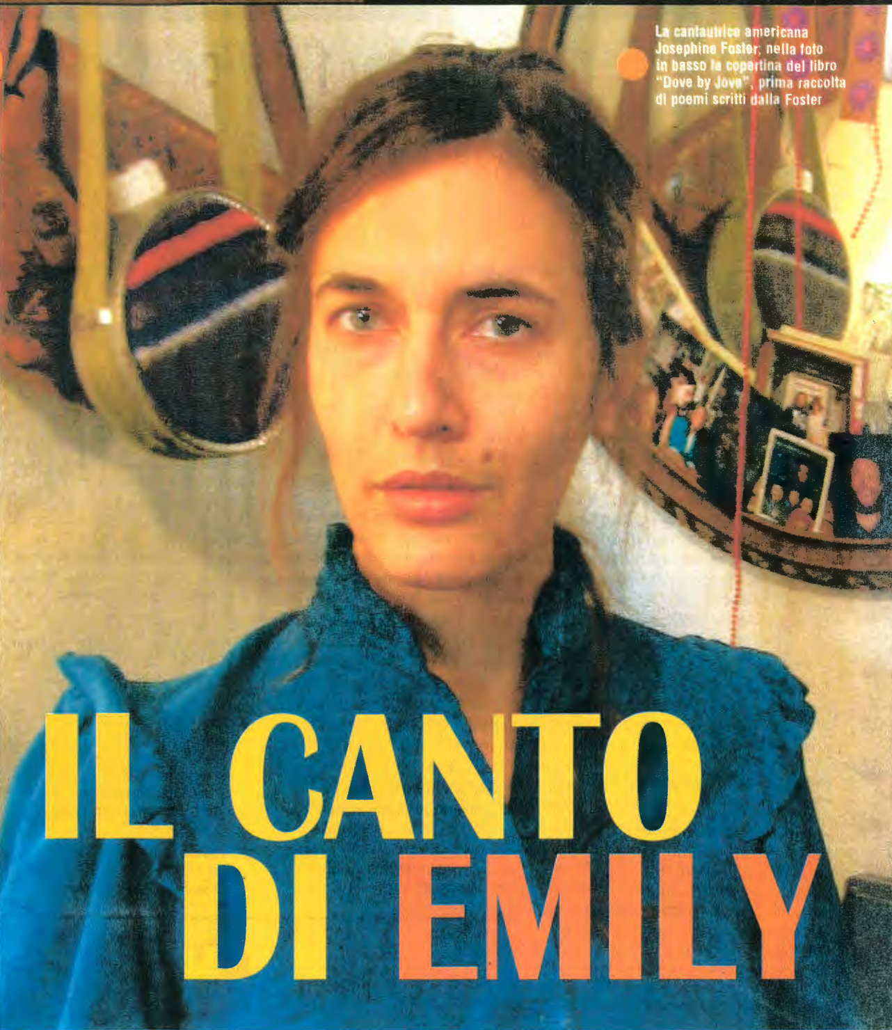
La cantautrice americana Josephine Foster, nella foto in basso la copertina del libro "Dove by Jove", prima raccolta di poesie scritte dalla Foster

Efesto era per i Greci il dio del fuoco ma anche della tecnologia. La mitologia dei coloni greci nel Sud Italia collocava la sua fucina ora nelle viscere dell'Etna ora in quelle di Vulcano, nell'arcipelago delle Eolie. Il mito vuole che Efesto fosse tanto brutto quanto perfezionista nella sua "artigianalità". Alla "manualità" che diventa arte ha rivolto il pensiero creativo Jacopo Leone, "artigiano" catanese dell'immagine e del pensiero che, conseguentemente, "ha pensato" di inventare un piccolo festival di musica, poesia e quant'altro, chiamato Etcetera Festival. In breve... Efesto: «Etcetera Festival è un festival di musica etcetera, intitolato a un Dio brutto e di cattivo carattere che - quando si applica - è un vero perfezionista: Efesto, l'unico a preferire l'Etna all'Olimpo». La perfezione di Etcetera sta nella sua imperfezione e nel suo work in progress. Basta vedere il sito www.efest.it e le lettere volutamente alla rinfusa per gli eventi ancora da definire. Il progetto parte in regime di assoluta autarchia - «Autoprodotto e privo di sponsor e patrocinio ormai troppo facili da rimediare» è il commento di Leone -, per poi in un secondo momento sviluppare eventuali collaborazioni con altre realtà.